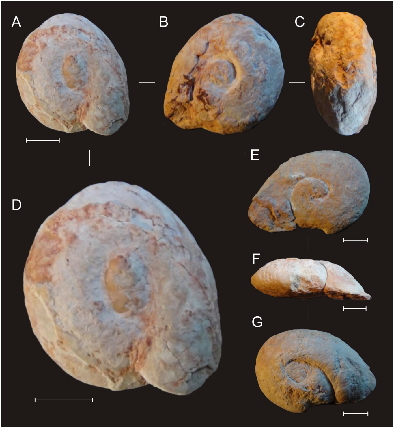
Planche 1. Lychnus provenant du Rognacien supérieur de Vitrolles, niveau 100 de la coupe A.

A–D. Lychnus siruguei nov.sp., holotype, MNHN.F.A59993 (Coll. Turin) ; A–C. Vues apicale, basale et abaperturale ; D. Grossissement de la vue apicale.